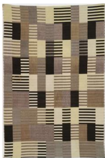
Tapis crée par Ani Albers

Tables gigognes 1928; théière 1924 forme géométrique simple avec poignées en ébène, lampe orange, cendrier conçus par Marianne Brandt.