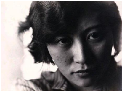
Michiko Yamawaki en 1930 (designer textile)