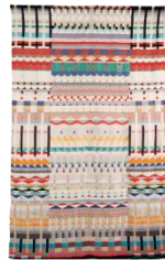
Tapis crée par Gunta Stözl