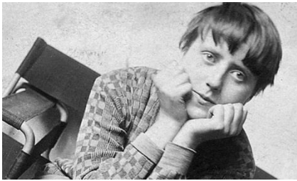
Katte Both (photographe, architecte)