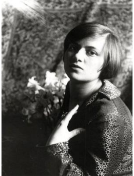
Marianne Brandt (photografe, designer)